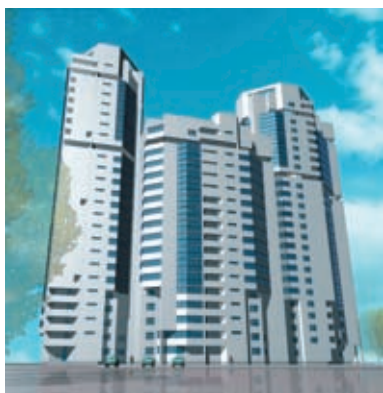
Жилой комплекс на ул. Радищева