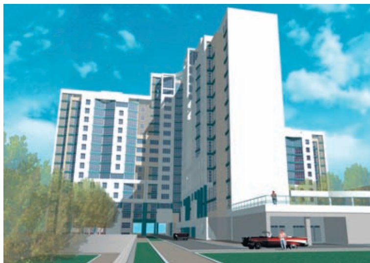
Жилой комплекс на ул. Шевелева