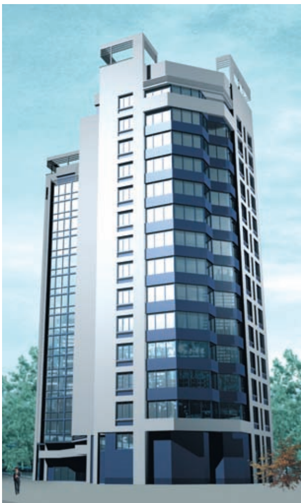
Жилой комплекс на ул. Пальмиро Тольятти