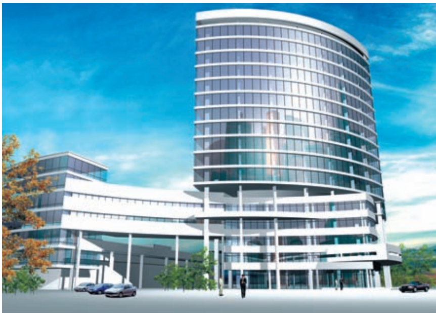
Административное здание на ул. 9 Января