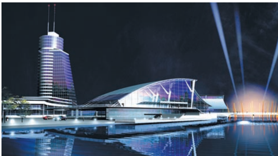
Международный выставочный комплекс на ул. Ткачей–Машинной

ЦЕНТР АРХИТЕКТУРЫ И СТРОИТЕЛЬСТВА был создан в 1991 году. Предприятие входит в Ассоциацию застройщиков г. Екатеринбурга, является членом ряда рабочих групп по реализации стратегического плана развития города до 2015 года.