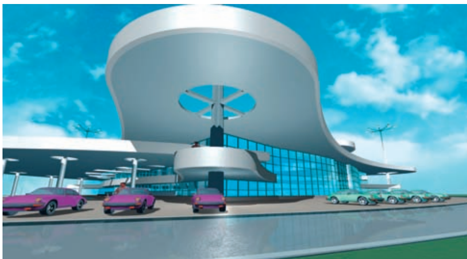
Автосалон на ул. Metallургов

За время существования у ЦЕНТРА АРХИТЕКТУРЫ И СТРОИТЕЛЬСТВА сложились продуктивные взаимоотношения с Администрацией г. Екатеринбурга, Свердловской организацией Союза архитекторов России и ведущими строительными организациями региона.