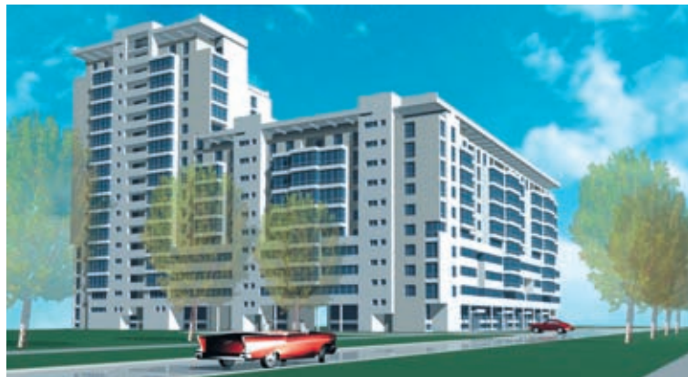
Жилой комплекс на ул. Чапаева