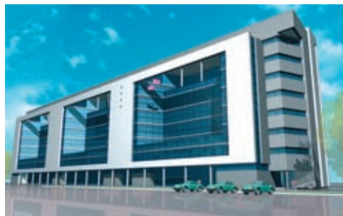
Административное здание на ул. Куйбышева