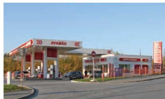
АЗС на пр. Космонавтов — ул. Маяковского в г. Екатеринбурге

На протяжении нескольких лет основными заказчиками компании являются: администрация г.Екатеринбурга, Муниципальное учреждение «Благоустройство», ЗАО ПСК «Урал-Альянс», ЗАО АСЦ «Правобережный», ЗАО «НОВА-Строй», ООО «ЛУКОЙЛ-Пермнефтепродукт», ОАО «СИБНЕФТЬ», ГП «СКОН», Управляющая компания «ОКАМИ» и т.д.