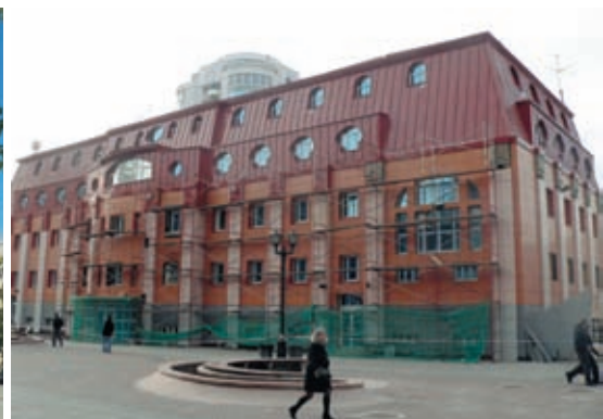
Здание на Вайнера, 34