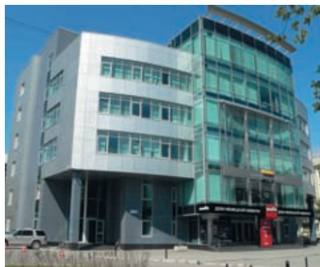
Здание на Малышева, 105

В своих расчётах специалисты ИВЦ «Технология» используют методику выявления остаточных ресурсов. Каждый объект уникален и индивидуален, но накопленные знания и навыки позволяют предприятию выявлять общие проблемы, а затем совместно с заказчиками искать наиболее эффективные и надёжные пути их решения.