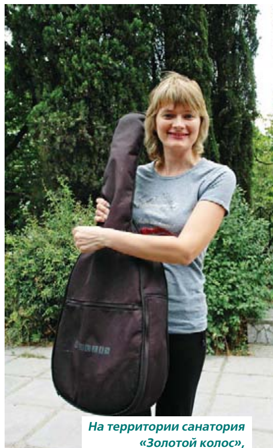
На территории санатория «Золотой колос», 29 июня