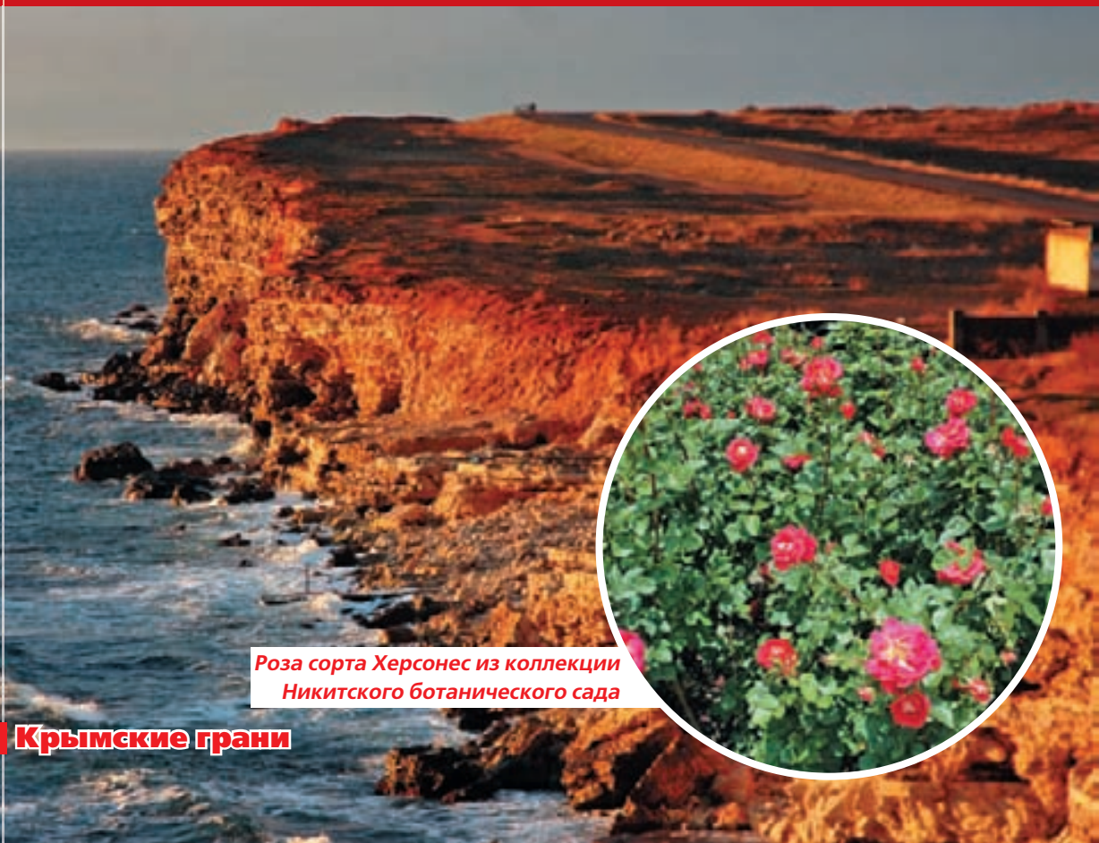
Роза сорта Херсонес из коллекции Никитского ботанического сада

В 2007 г. Национальный заповедник Херсонес-Таврический вошёл в список «7 чудес Украины».