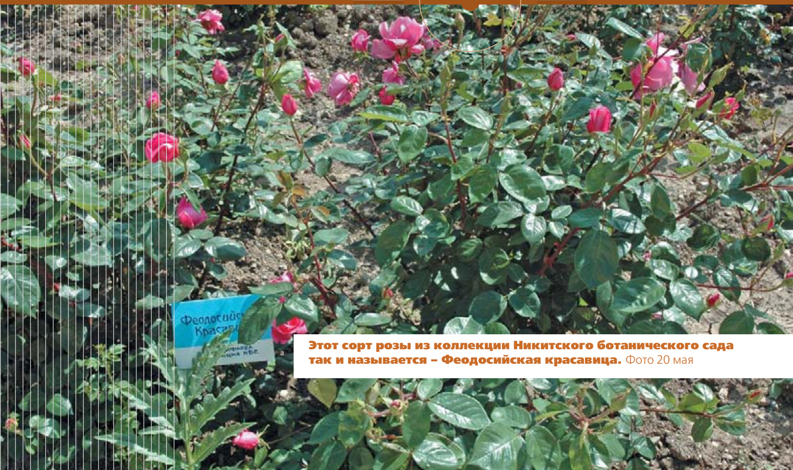
Этот сорт розы из коллекции Никитского ботанического сада так и называется – Феодосийская красавица. Фото 20 мая