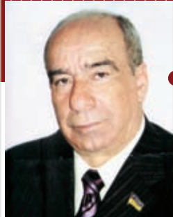
Дейч Борис Давыдович, народный депутат Украины:

«Крым – благословенное место, привлекающее туристов всего мира. Откройте для себя Судак – один из лучших крымских курортов. Уверен, что вам понравится этот замечательный уголок Юго-Восточного Крыма и пребывание здесь запомнится на долгие годы. Буду рад новым встречам на прекрасной крымской земле».