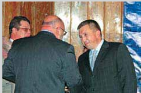
Лучшее оздоровительное учреждение 2 место – Дочернее государственное унитарное предприятие «Пансионат «Зенит», Судакский район

Судакский городской Совет и отдел по курортам и торговле рассматривают Судакский регион как курорт для элитного отдыха.