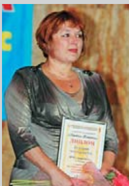
За лучшую организацию экскурсионной деятельности 2 место – МЧП «Меридиан», г. Судак